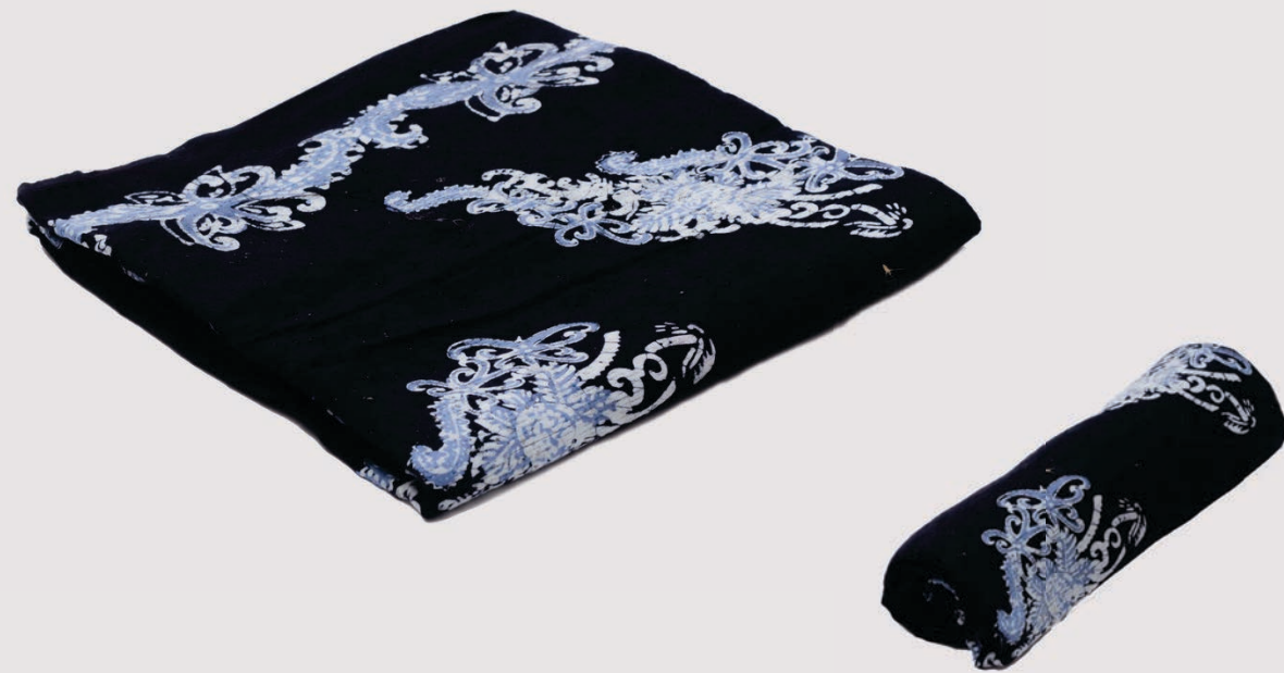
Motif Jajaran buah Mangrove