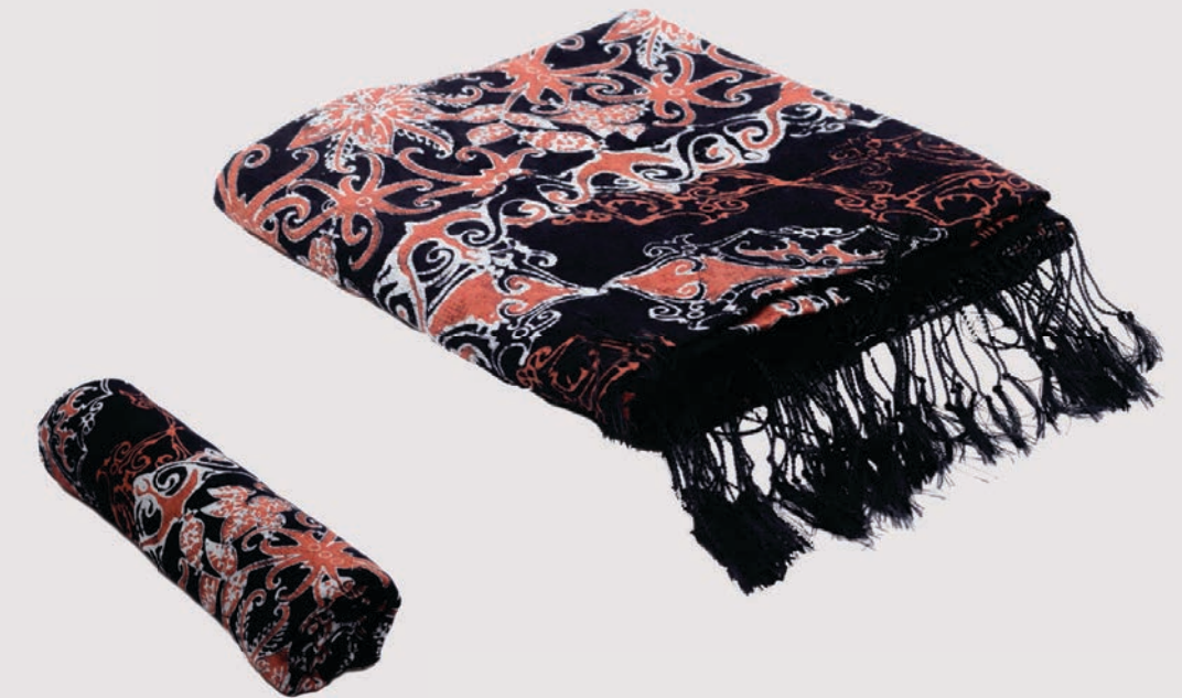
Motif kombinasi Perisai dan Bunga Karamunting